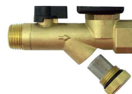
Filtro con grifo integrado

La información proporcionada en este documento se supone precisa y fiable. Sin embargo, no se asume alguna responsabilidad en relación con el uso o violación de patentes o derechos de terceros, derivados de su uso. El fabricante se reserva, además, el derecho a revisar la información sin previo aviso y sin incurrir en obligación.