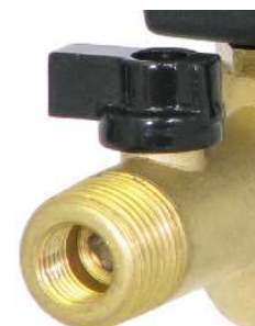
Diseño con entrada doble